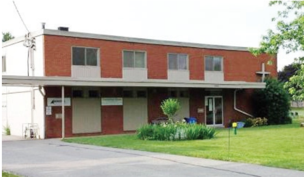
Arise and Shine at Friendship house