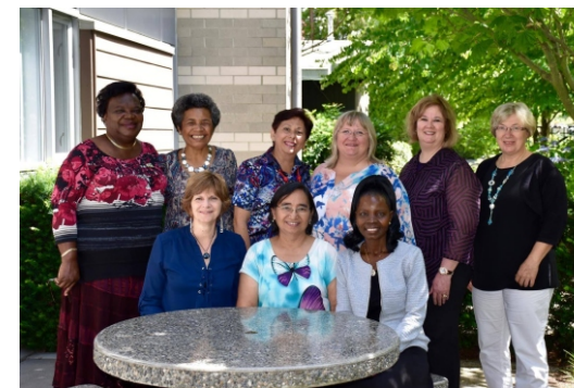
The Executive Board of the BWA Women's Department

Le donazioni possono essere fatte anche online su www.bwawd.org cliccando su Donate (Donazioni) e poi su "e-giving". Le donazioni possono essere mandate da tutto il mondo usando la carta di credito. Risparmiate tempo e soldi. La ricevuta/bonifico sarà mandato con 50% all'Unione Europea e 50% alla BWA WD.